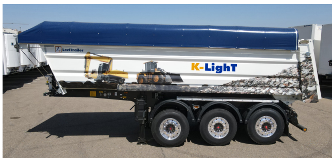
Desenho compacto, excelente manobrabilidade