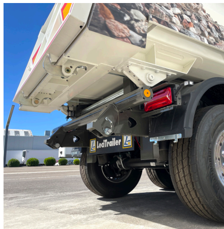
Pára-choques dobrável e protetores para asfalto