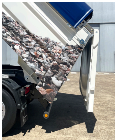
Porta de abertura vertical de duplo giro