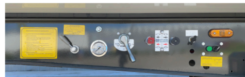
Suspensão de três posições e ajuda à tração