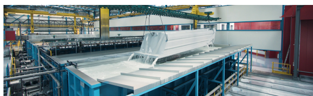
KLT: Protecção anti corrosão em chasis y caja por cataforesis